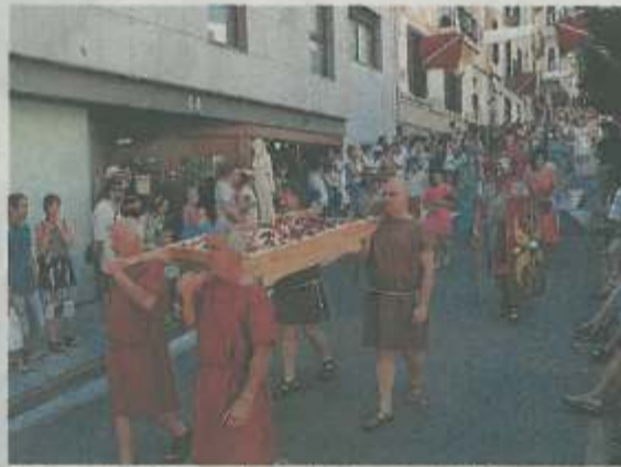
Cuatro devotos portaron la imagen de Isis.