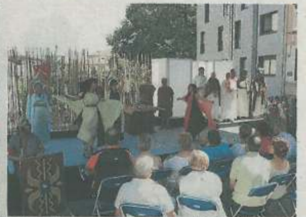
Bailes en honor a la deidad antes de iniciar la marcha.

El escritor romano Apuleyo fue el encargado de guiar al público durante el rito